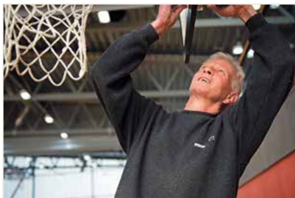
ILL.FOTO: JAN LILLEHAMRE