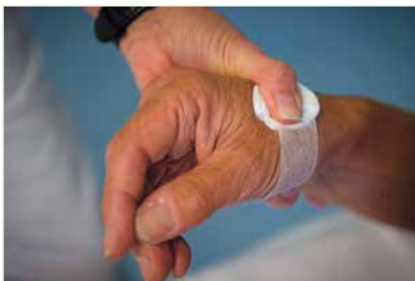
ILL.FOTO: JAN LILLEHAMRE