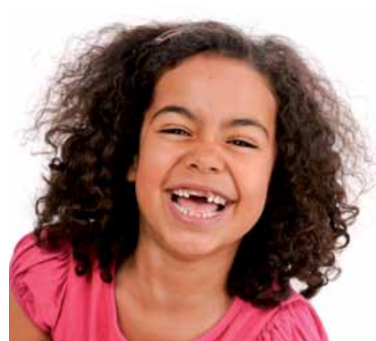
Liten, men ikke hjelpeløs. Klart vi kan rydde og hjelpe til.

funksjonsevne vil for eksempel trenge lenger tid for å komme inn i arbeidssituasjonen, eller for å utføre noen typer oppgaver.