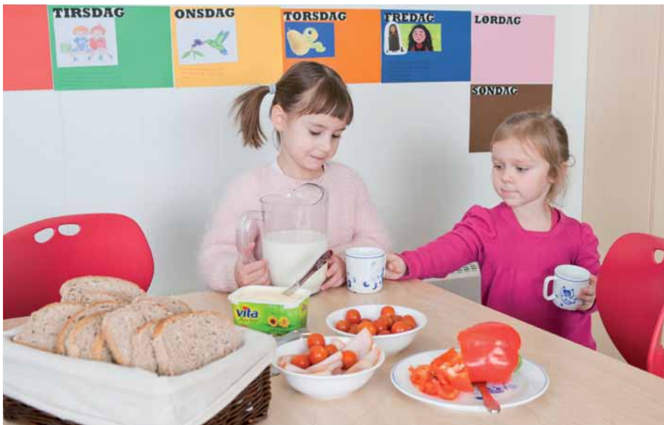
Livet er ikke bare en lek. De minste kan også gi en hjelpende hånd.