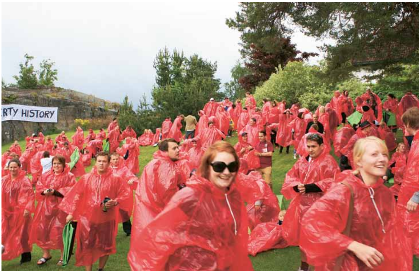
Rød i regnvær: Det regna under åpninga av Sommerkonferansen 2010 på Stavarn.